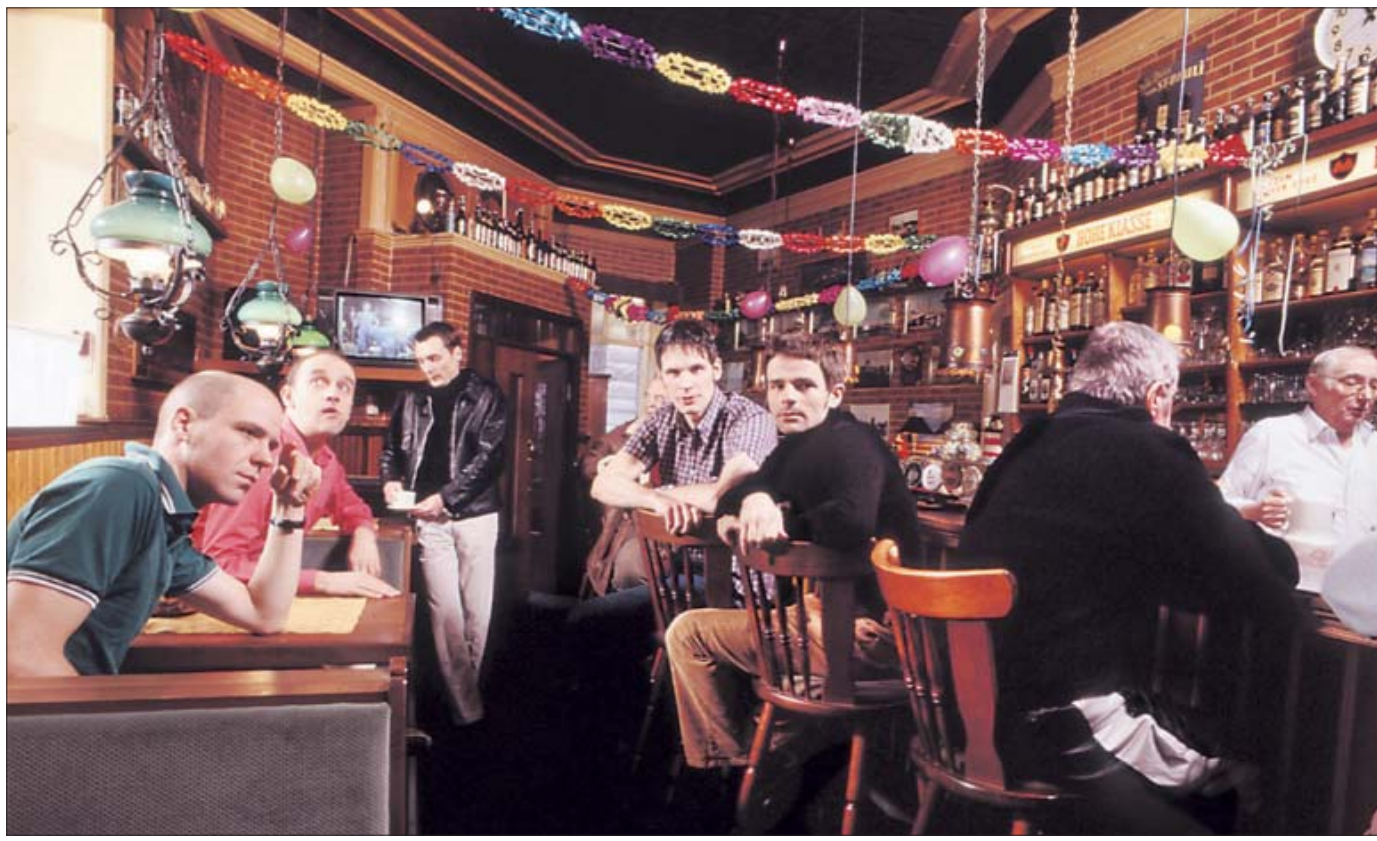
„In der Kneipe ist immer so Stimmung“: Die HSV-Fans von Superpunk wollen bei der Fußball-WM überall sein – wenn möglich nur nicht im Stadion oder auf Tour.